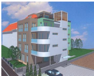
Vizualizace původní podoby záměru na zástavbu Bílého 14.

Už v minulém Zpravodaji jsme Vás informovali o snahách investora NYLANDS s.r.o. postavit na parcele po původním dvoupodlažní vile šestipodlažní (!) bytový dům. V dřívějším územním řízení (r. 2008) jsme dokázali stavební úřad přesvědčit o tom, že hmotové a architektonické řešení s okolím a začleněním do uliční zástavby nesouladí. Byť toto rozhodnutí bylo následně nadřízeným brněnským magistrátem po odvolání developera zrušeno, stalo se tak jen kvůli tomu, že úřad použil „příliš obecnou“ argumentaci; šlo tedy pouze o vadu formální, nikoli obsahovou, která by měla nazíraní úřadu změnit. Poté si stavební úřad vyžádal od investora doplnění podkladů. Ty však – vzhledem k dalším plánům – nebyly předloženy a řízení bylo v lednu 2010 zastaveno. Investor totiž mezitím vypracoval nový architektonický návrh, který hned v únoru 2010 podal na stavební úřad a zahájil tak nové územní řízení.