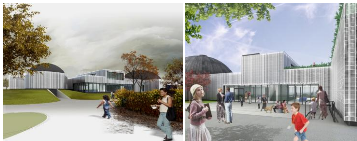
Vizualizace Rudiš-Rudiš architekti s.r.o., 2009

tivum – auta (většinou osobní) různých dodavatelů parkují na trávníku i mezi stromy, byť lze vozidla umístit na blízké příjezdové cestě. Na daný problém jsme upozornili jak vedení hvězdárny, tak generálního zhotovitele – bohužel není v jejich silách dohlížet na desítky subdodavatelů, a proto nezbyvá než v takových případech volat městskou policii.